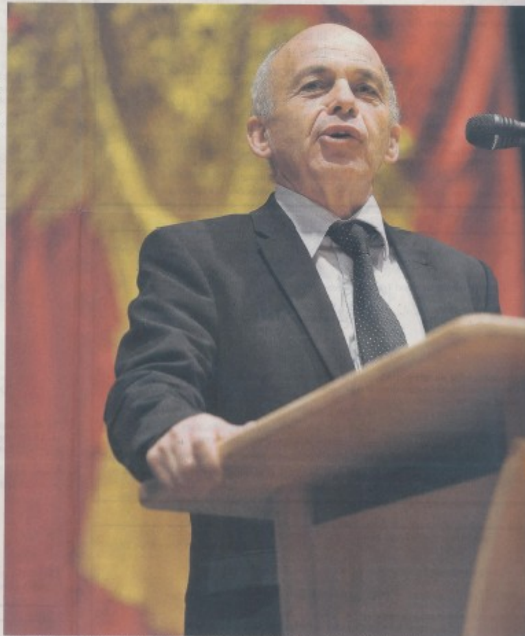
«Die Armee ist eine Baustelle.» Bundesrat Ueli Maurer referierte am Mittwochabend im Hombrechtiker Blattensaal.

«Wir brauchen die beste Armee der Welt. Das meine ich ernst», sagte Maurer. Die Armee müsse innert kurzer Zeit mobilmachen können. Denn der Zweck bleibt der Gleiche: Abwehr eines militärischen Angriffes. Ein solcher Angriff könne aber künftig eine ganz andere Form haben. In der anschliessenden Diskussion fiel das Stichwort Cyber-War. Dabei schliesst sich jemand in das EDV-System des Feindes ein, um an geheime Daten zu kommen oder das System lahmzulegen. «In Sachen Schutz vor Cyber-War», sagt Ueli Maurer, «gehören wir europaweit zu den Besten.»